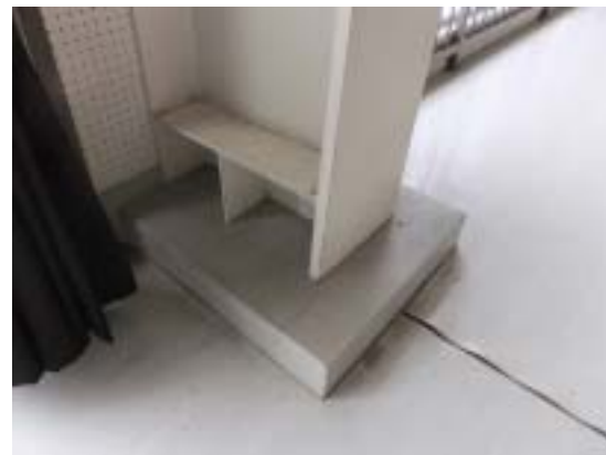
写真 14 十日町市水沢中学校体育館の鉄骨柱脚のかぶりコンクリートのひび割れ