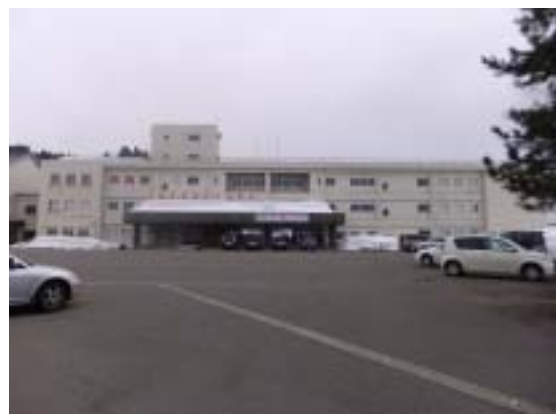
写真7 十日町市水沢中学校 RC 造 3 階校舎全景