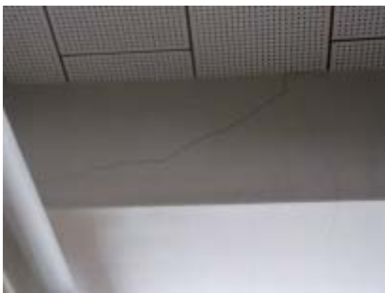
写真 23 十日町市浦田小学校 RC 造校舎 の 3 階の梁（写真 21 の 3 階部分、2 階同 様せん断ひび割れが見える）