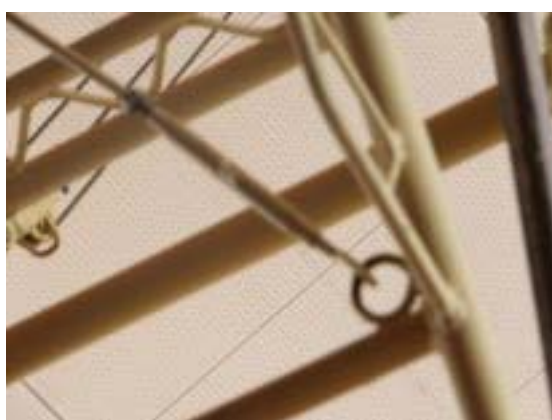
写真4 バスケットボールのフックがはずれる（すぐになおした）