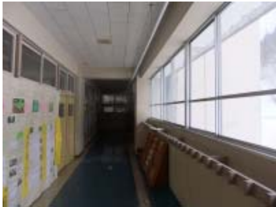
写真 21 十日町市浦田小学校 RC 造校舎 廊下内部 2 階（桁行きは 1 教室 1 スパン の長いスパン、梁間の梁がみえるがそこ にせん断ひび割れがはいつている。両側 は耐震壁なので、強制変形が大きい）