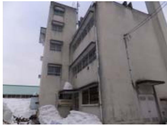
写真 20 十日町市浦田小学校 RC 造校舎 全景（廊下側と階段室）