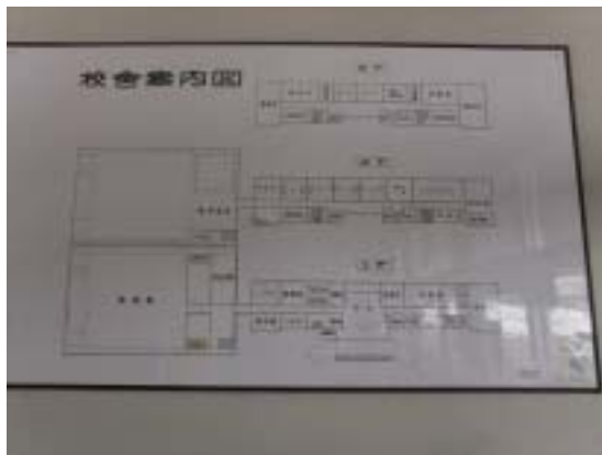
写真6 十日町市水沢中学校の学校案内図