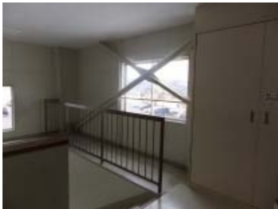
写真 11 十日町市水沢中学校体育館のブレース脚部の鉄骨柱脚のかぶりコンクリートのひび割れ