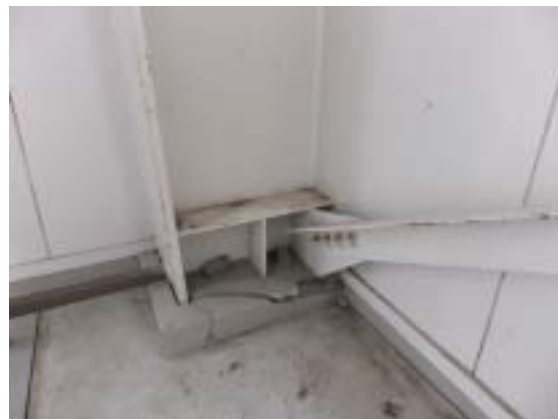
写真 12 十日町市水沢中学校体育館のブレース脚部の鉄骨柱脚のかぶりコンクリートのひび割れ