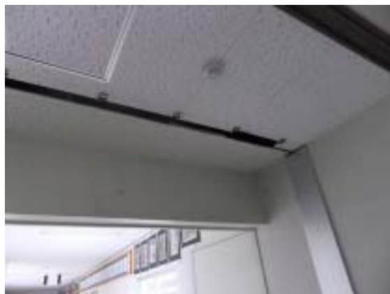
写真 16 十日町市水沢中学校体育館 2Fの柔剣道場の天井の浮き