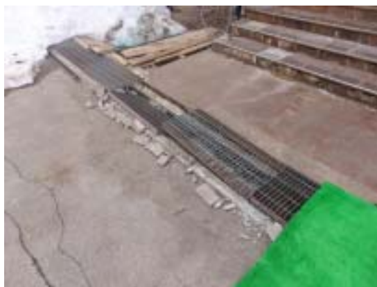
写真 18 十日町市奴奈川小学校の玄関前の地盤の変状