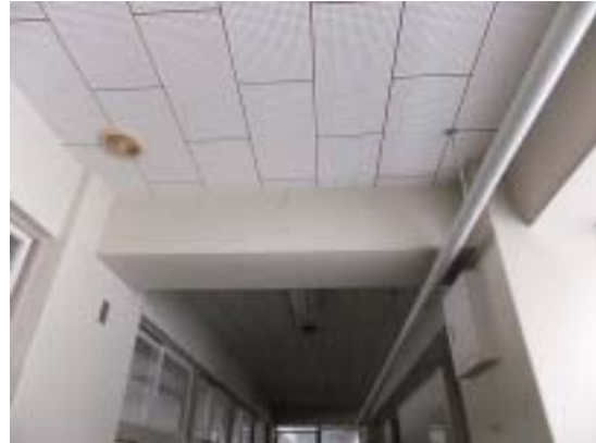
写真 22 左の写真の梁の詳細(十日町市 浦田小学校 RC 造校舎廊下内部 2 階、せん 断ひび割れが見える)