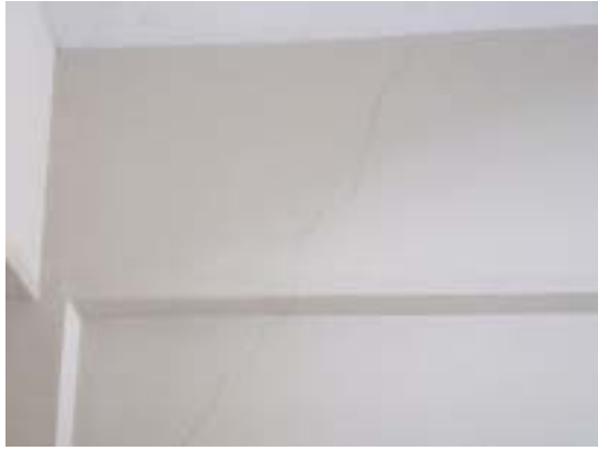
写真 25 十日町市浦田小学校 RC 造校舎の 1 階の梁間の壁（せん断ひび割れが観察されている）