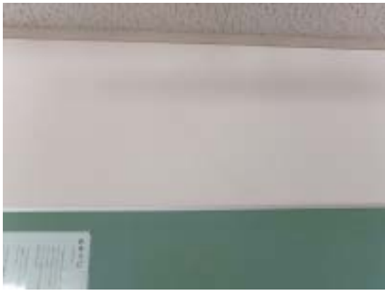
写真 10 十日町市水沢中学校 RC 造 3 階校舎の耐震壁のせん断ひび割れ