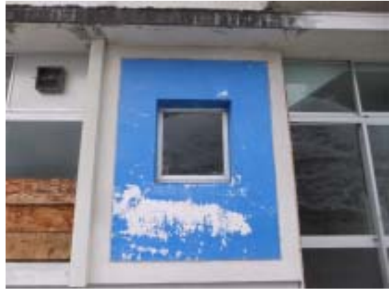
写真 26 十日町市浦田小学校 RC 造校舎の 1 階の桁行きの雑壁の開口のひび割れ