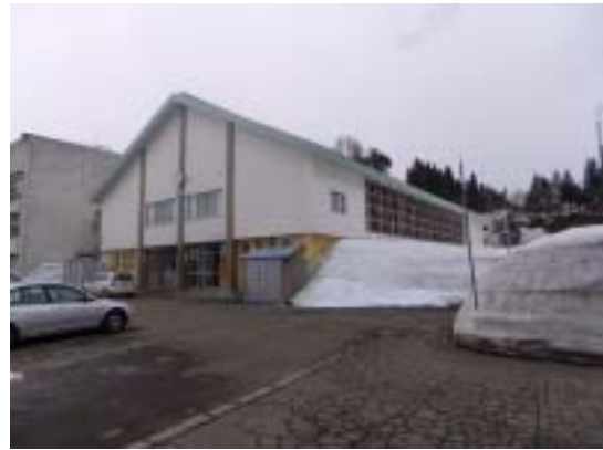
写真 28 十日町市浦田小学校体育館(地震直後は避難所として使われていた)