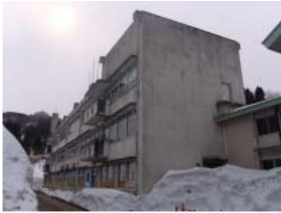
写真 19 十日町市浦田小学校 RC 造校舎 全景（教室側）