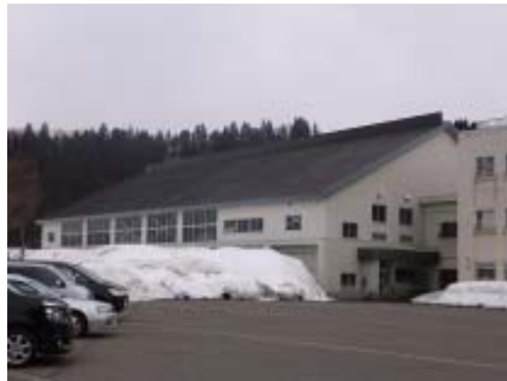
写真 11 十日町市水沢中学校体育館全景