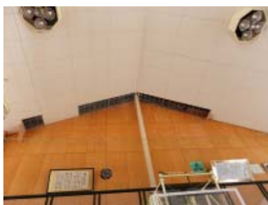
写真2 津南町中津小学校体育館の天井材の落下