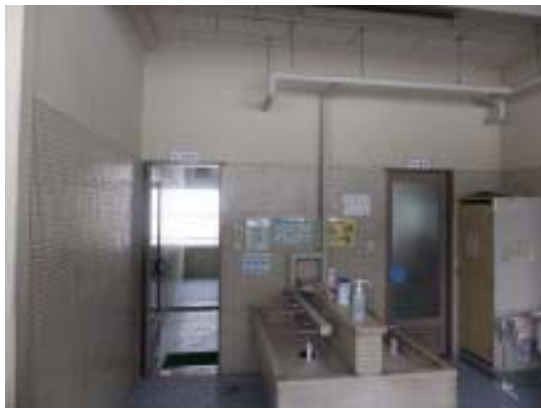
写真 27 十日町市浦田小学校 RC 造校舎の 1 階の桁行きの雑壁の開口のひび割れ