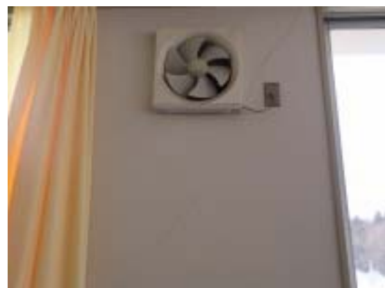
写真9 十日町市水沢中学校 RC 造 3 階校舎の雑壁のせん断ひび割れ