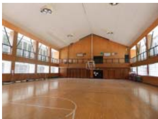
写真3 津南町中津小学校体育館の内部（落下した天井材は撤去されている）