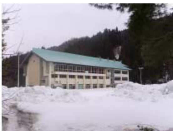
写真1 津南町中津小学校体育館と後ろのRC校舎面全景