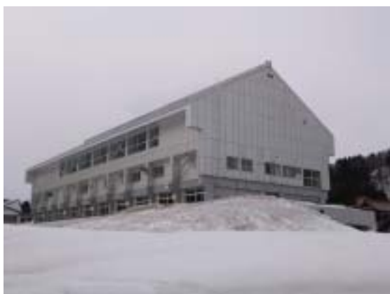
写真 17 十日町市奴奈川小学校全景