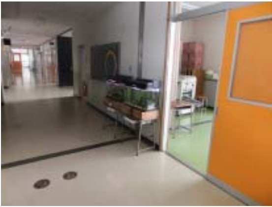
写真5 津南町中津小学校体育館と RC 部分の EXP.J. は損傷無し