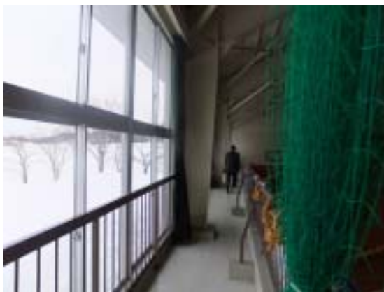
写真 13 十日町市水沢中学校体育館の鉄骨柱脚のかぶりコンクリートのひび割れ