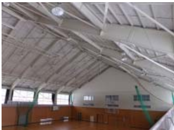
写真 15 十日町市水沢中学校体育館の内部（手前の電灯が1箇所傾いたとのこと）