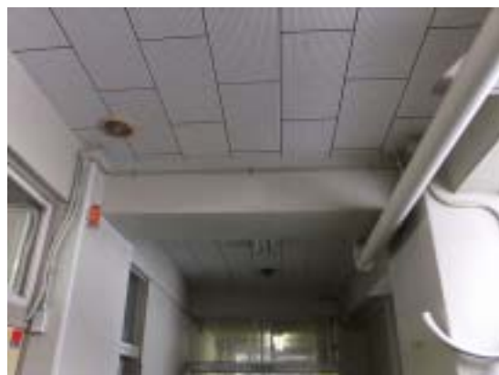
写真 24 十日町市浦田小学校 RC 造校舎 の 1 階の梁（写真 21 の 1 階部分、1 階に はせん断ひび割れが観察されていない）